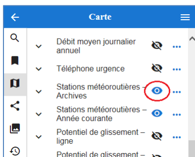
Figure 2 : Procédure d'affichage des données archivées

Les données de profondeur de gel et de dégel mesurées à chaque jour au cours des périodes hivernales précédentes seront alors disponibles pour chaque station météorologique. Si une période hivernale est en cours, les données archivées seront affichées à la suite des données de la période hivernale en cours.